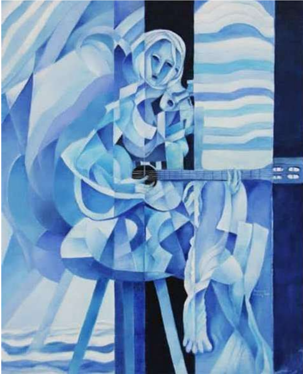
La música en azul. Óleo sobre tela. Medidas 100 x 80 cm.