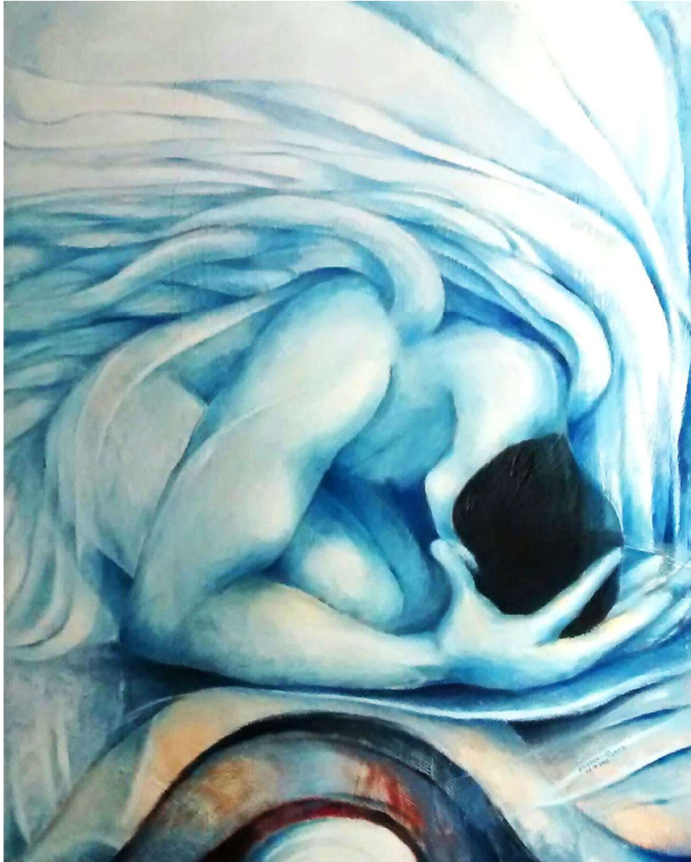
El ángel. Óleo sobre tela. Medidas 100 x 80 cm.