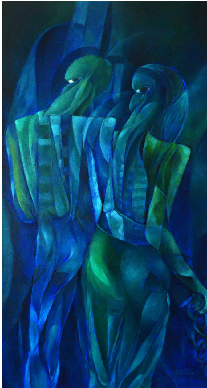
Los desterrados. Óleo sobre tela. Medidas 120 x 60 cm.