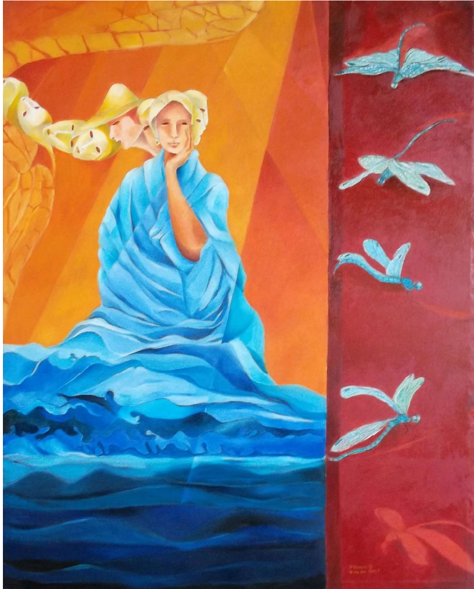
Encuentro con las libélulas. Óleo sobre tela. Medidas 100 x 80 cm.