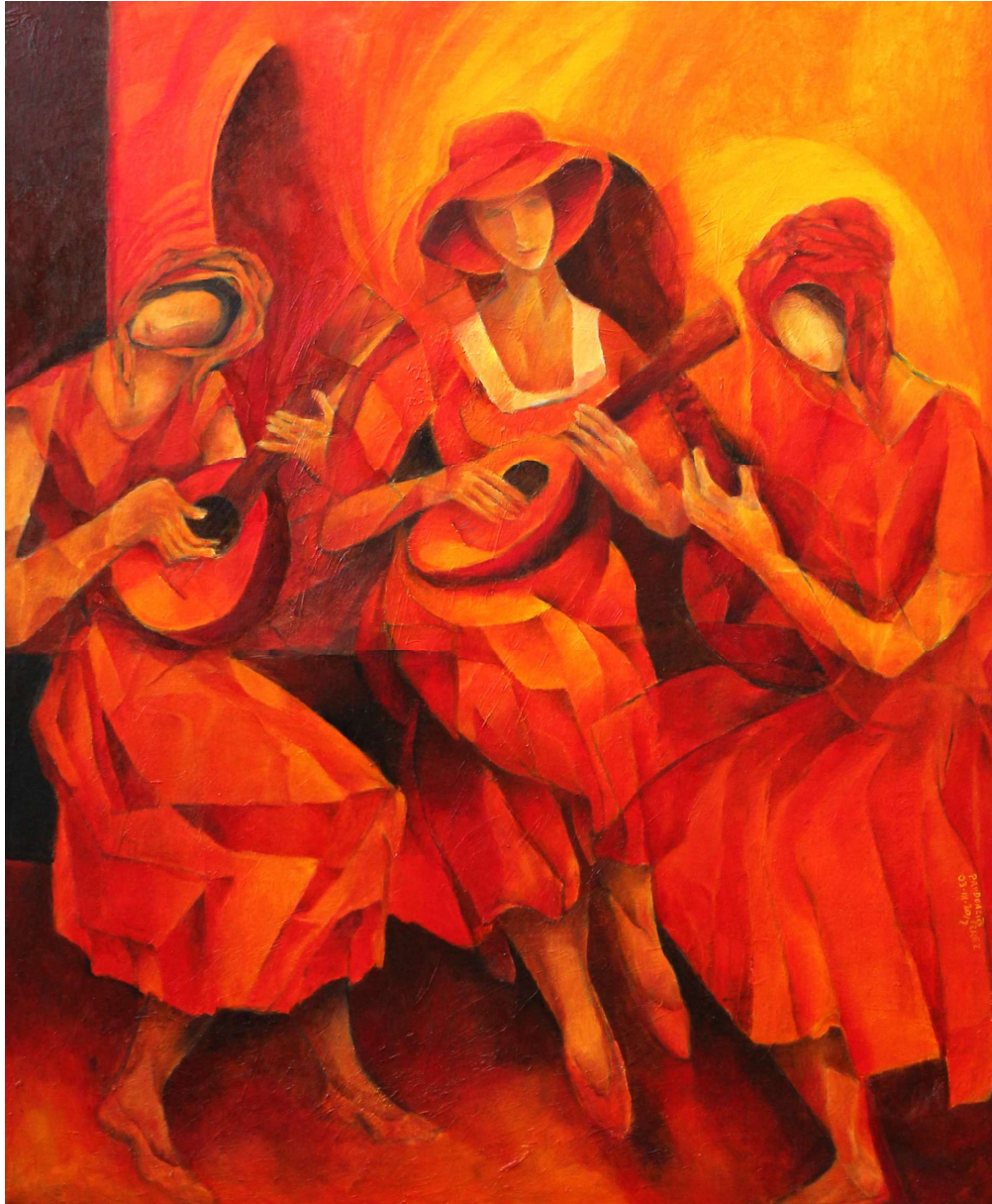
Las músicas. Óleo sobre tela. Medidas 100 x 80 cm.