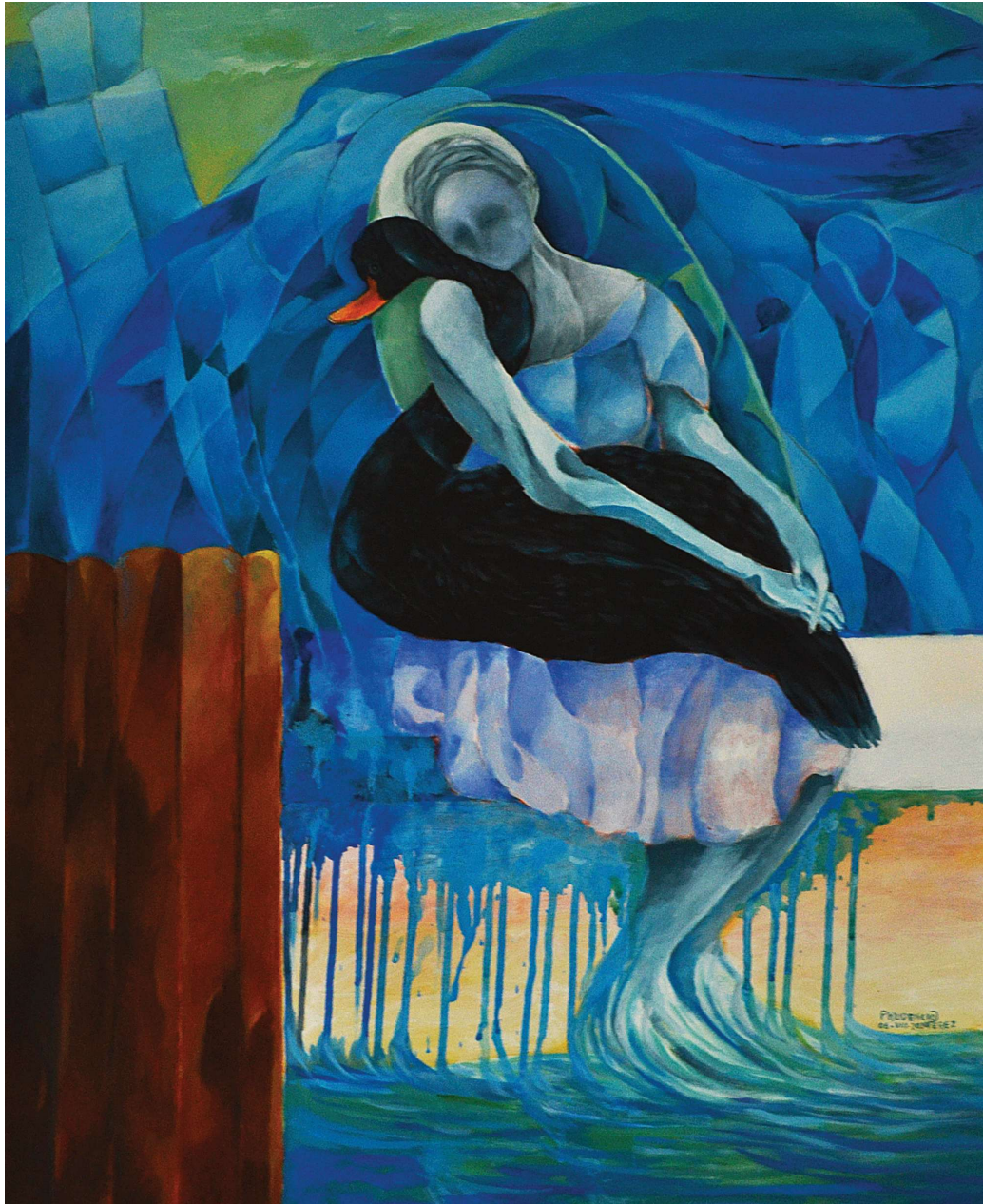
El encuentro. Óleo sobre tela. Medidas 80 x 60 cm.