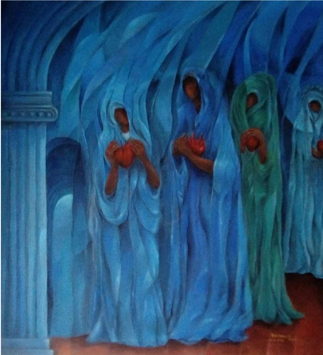
La procesión. Acrílico sobre tela. Medidas 70 x 80 cm.