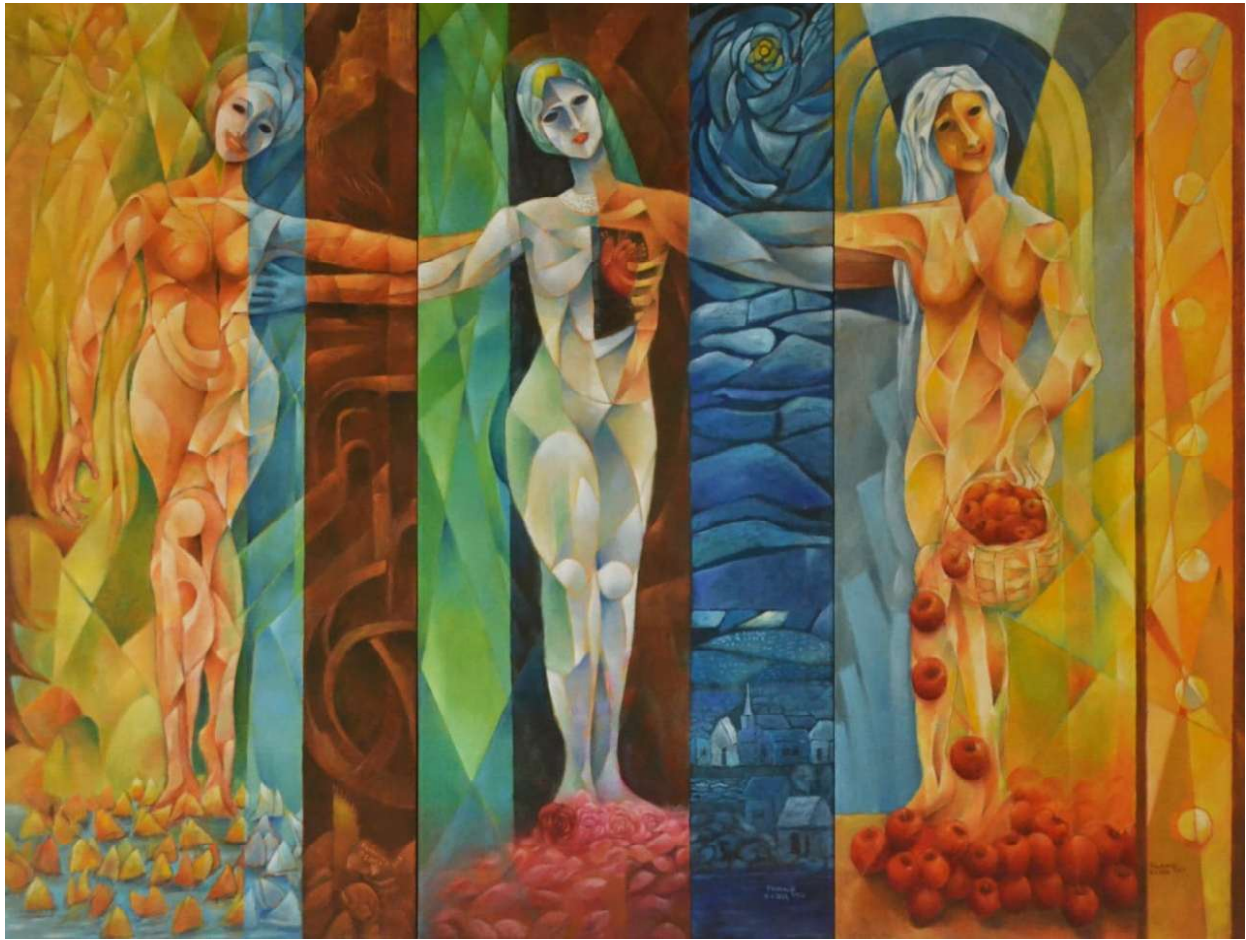
Las tres gracias ( tríptico). Óleo sobre tela. Medidas 200 cm x 150 cm.