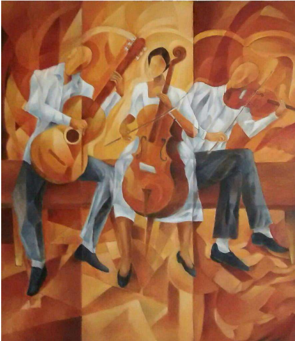
Los concertistas. Óleo sobre tela. Medidas 100 x 80 cm.