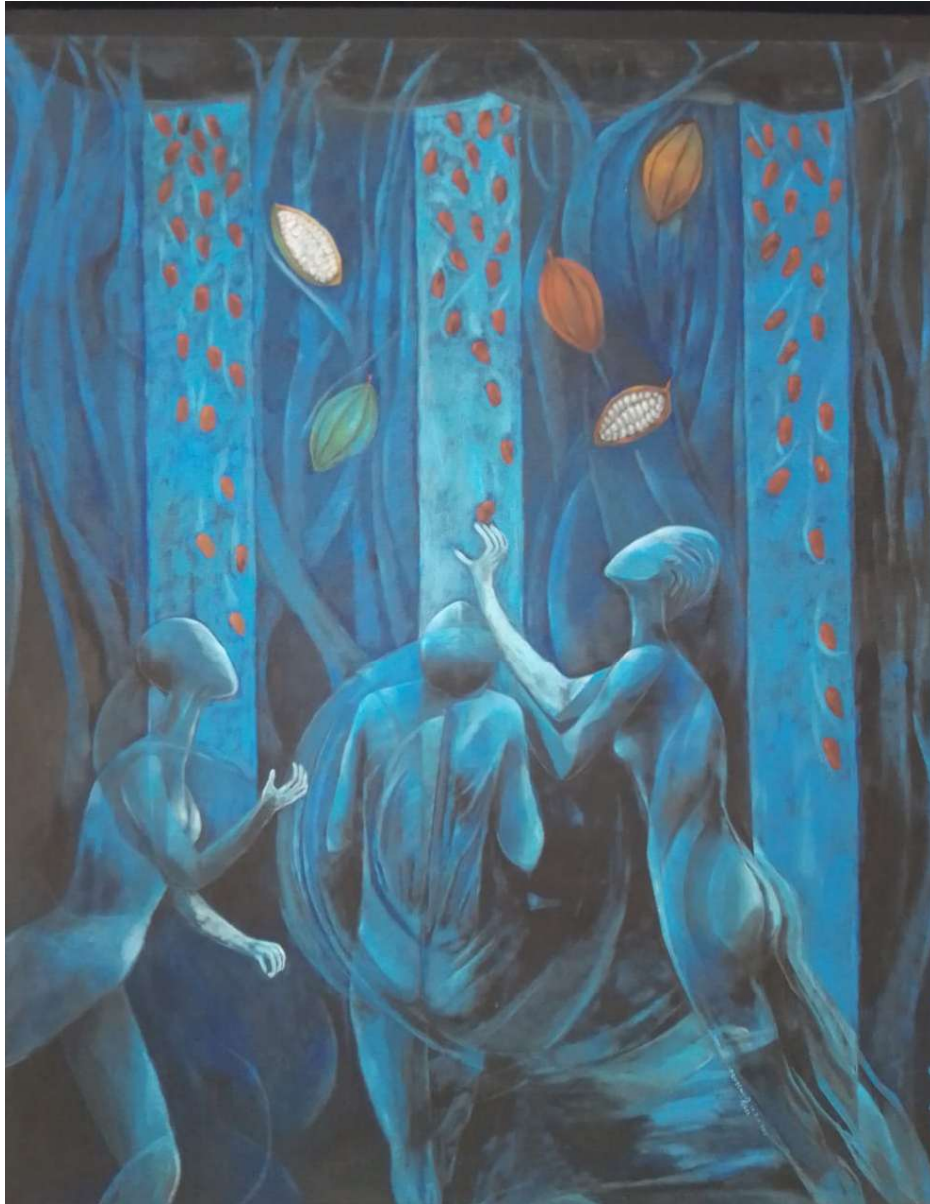
Ojalá que llueva cacao. Acrílico sobre tela, 100 cm x 80 cm.