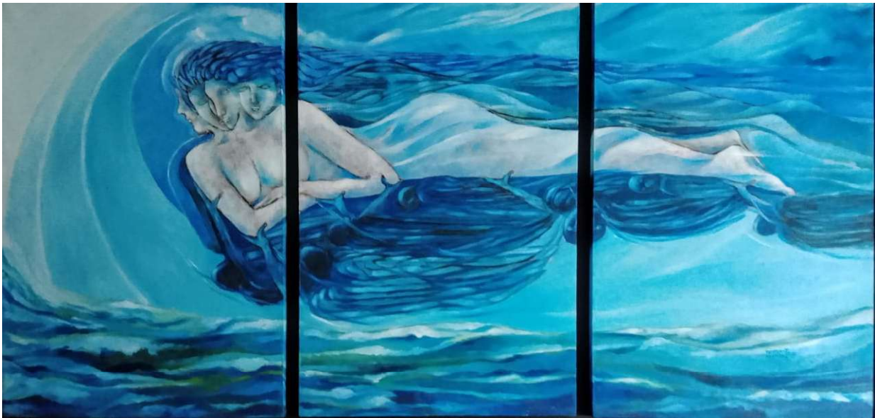
El viaje de la reina (tríptico). Óleo sobre tela. Medida 120 cm x 60 cm.