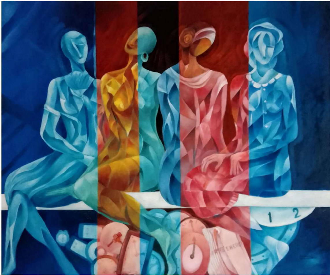
Cuatro mujeres. Óleo sobre tela. Medidas 150 x 120 cm.