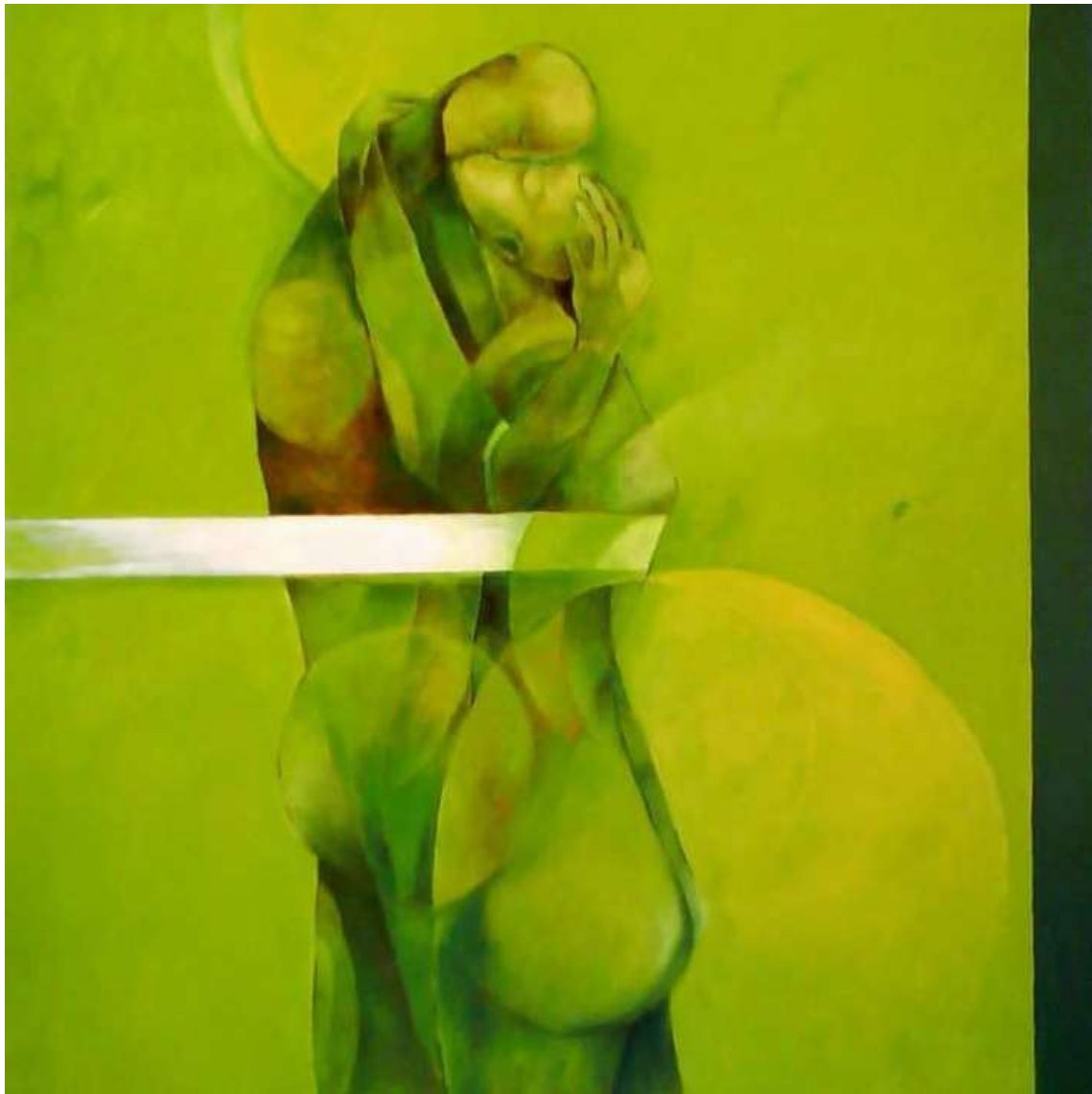
Claro de luna. Óleo sobre tela. Medidas 100 x 80 cm.