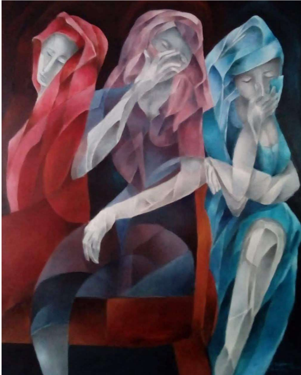
Las tristezas. Óleo sobre tela. Medidas 100 cm x 80 cm.