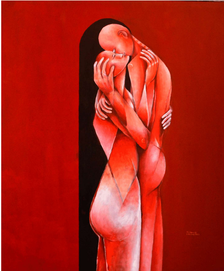
Pareja en rojo. Acrílico sobre tela. Medidas 120 x 100 cm.