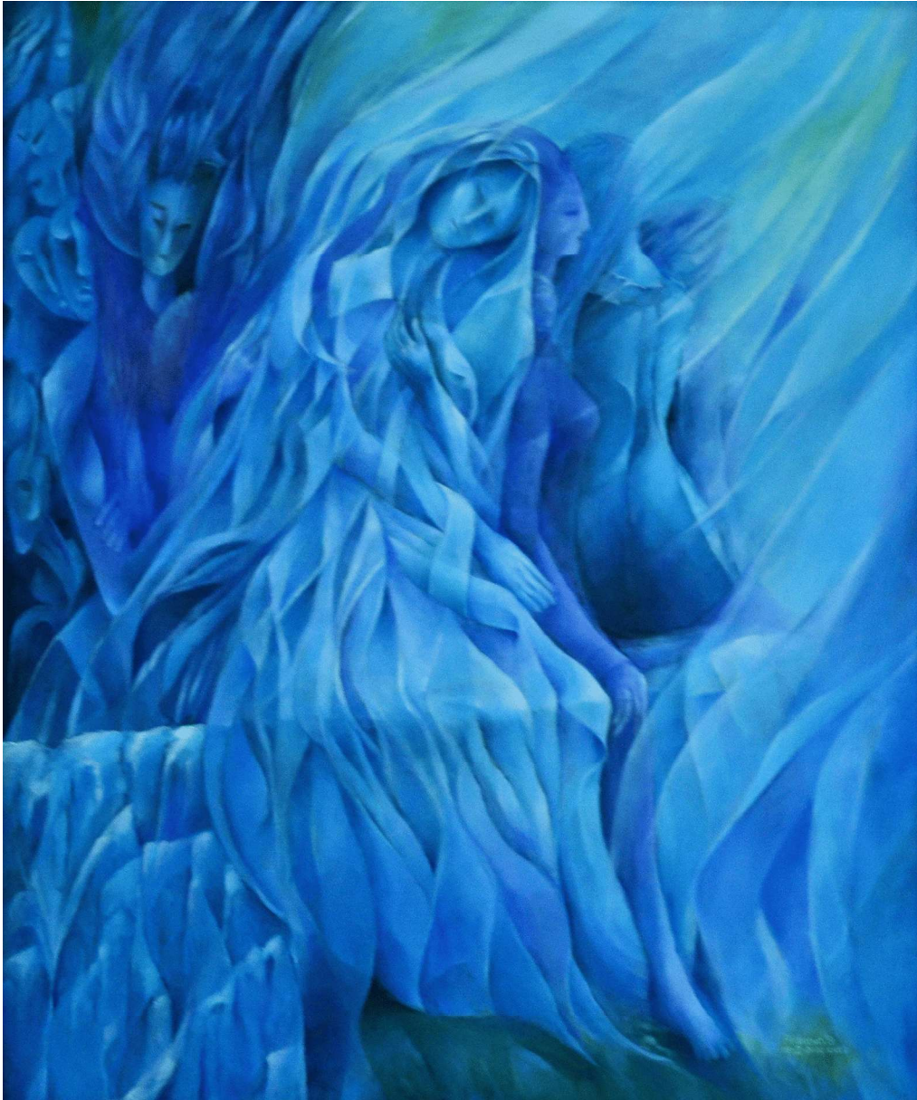
Estrecho de Bering. Óleo sobre tela. Medidas 100 x 80 cm.