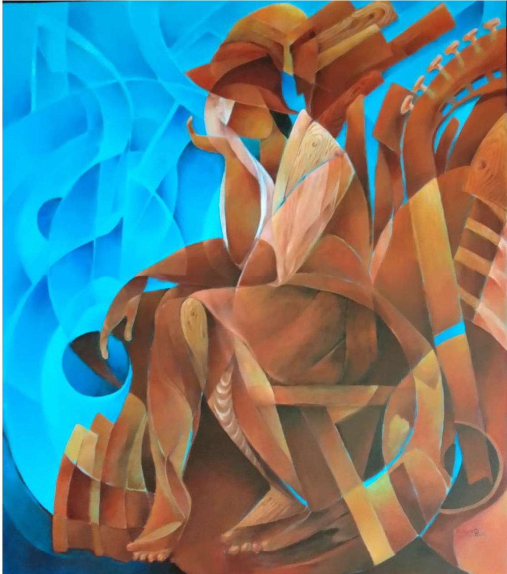
Mujer de madera. Óleo sobre tela. Medidas 90 cm x 75 cm.