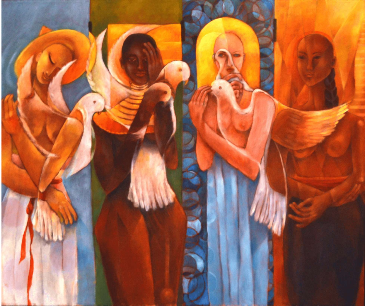
Las razas. Óleo sobre tela. Medidas 120 x100 cm.