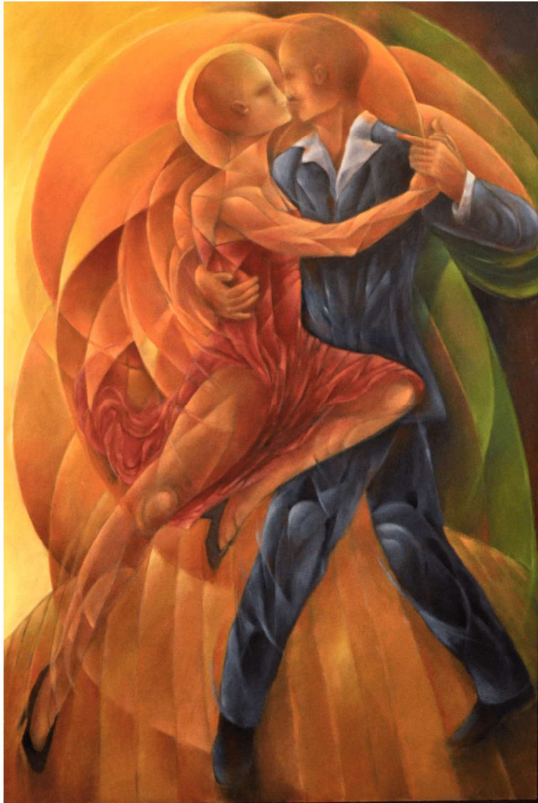
La danza. Óleo sobre tela. Medidas 115 x 80 cm.