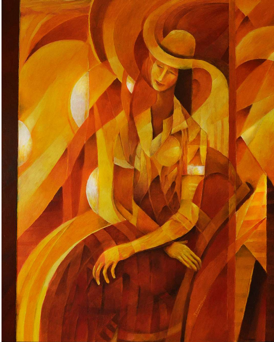
Iluminada. Óleo sobre tela. Medidas 100 x 80 cm.