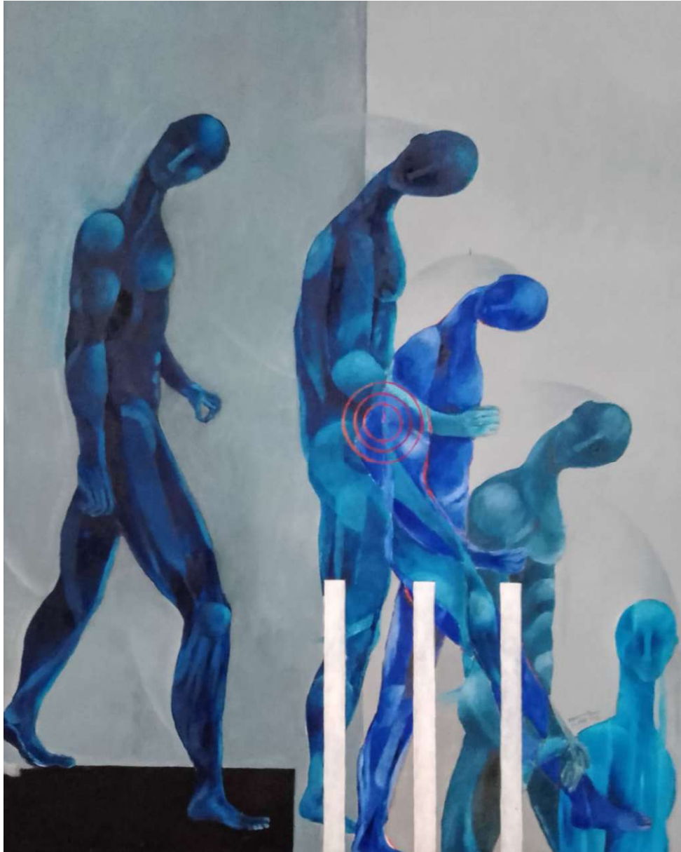
Caída libre. Óleo sobre tela. Medidas 100 x 80 cm.