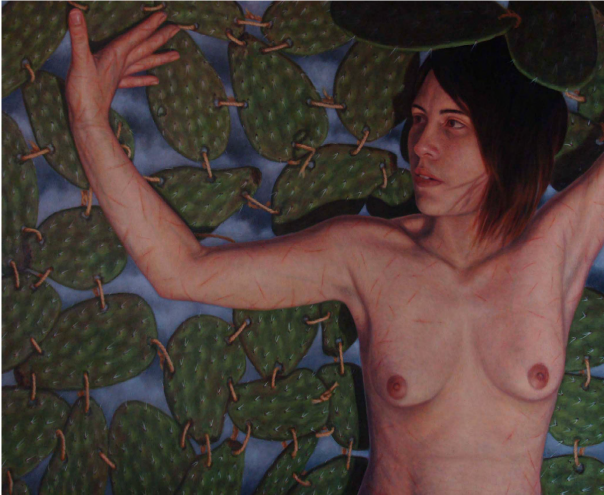
Bajo la lluvia