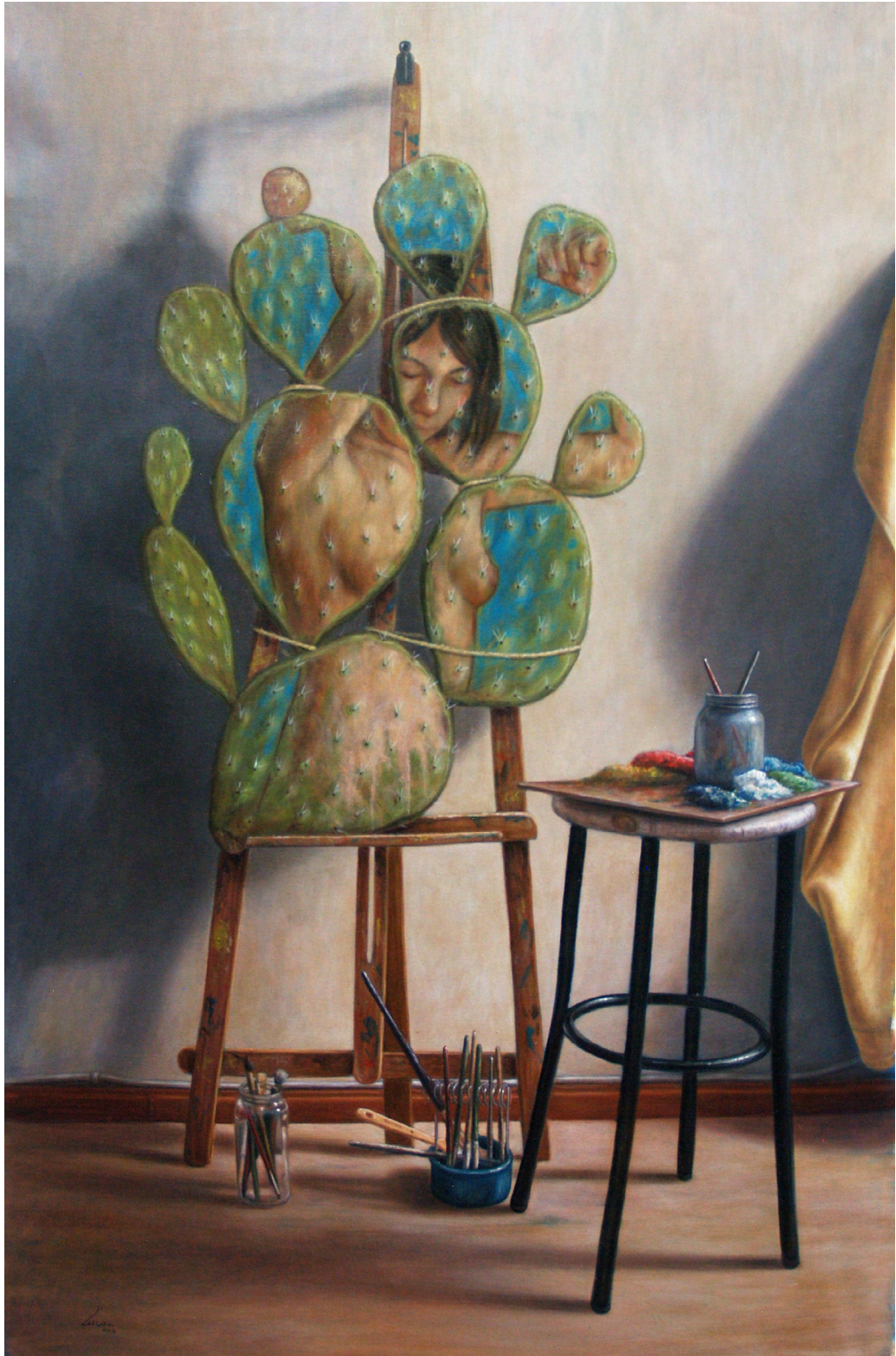
Aprendiz de pintor