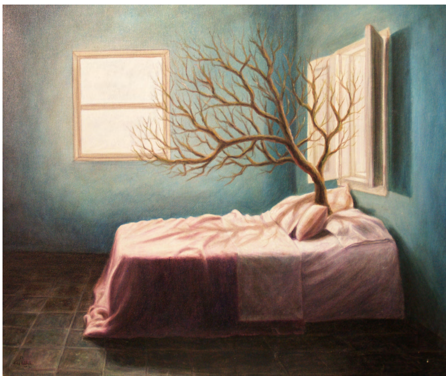
Flor de sueño