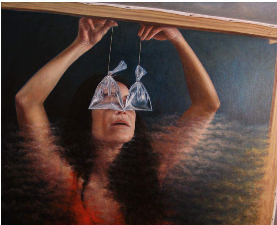
Ojos de agua