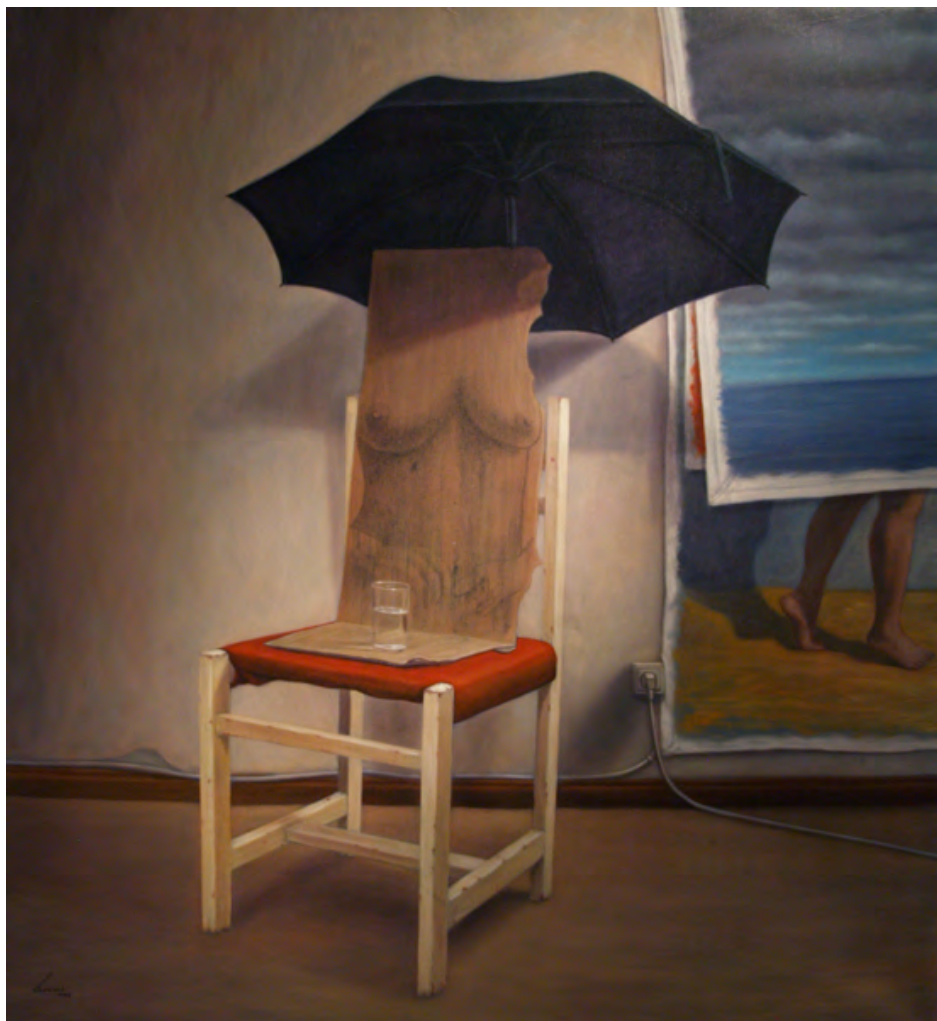
Por si la lluvia